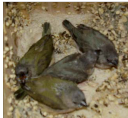
18 napos kitollasodott fiókák, melyek 1-2 nap múlva kirepülnek a fészekből