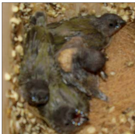
16 napos fiókák