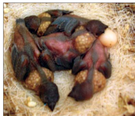
A 8 napos fiókákon már megjelentek az első szárnytollak

Amennyiben sikerült beszerezni a megfelelő madarakat, melyek megszokták a he-